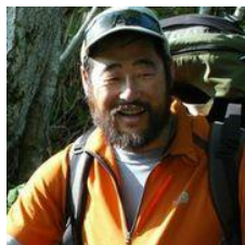
《山岳ガイド 滝澤さんより》

※写真はイメージです。※全コース、緑清荘まで送迎いたします。 ※帰着後、緑清荘での入浴無料(レンタルタオル→別途200円)